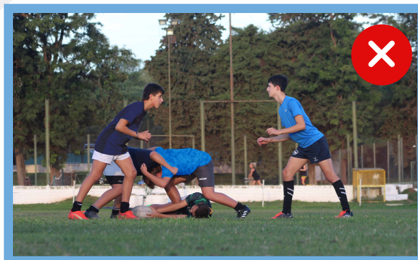
Líneas de offside creadas por un jugador de pie sobre la pelota