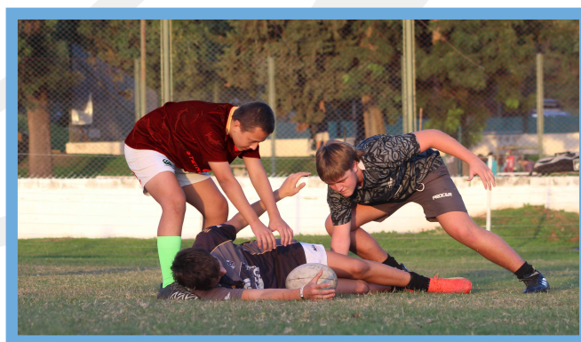
El jugador tackleado debe liberar la pelota inmediatamente