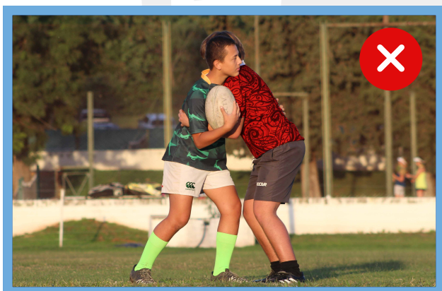
Maul no formado

Mantener la continuidad del juego cuando se hayan agotados las opciones de carreras, kicks y pases.